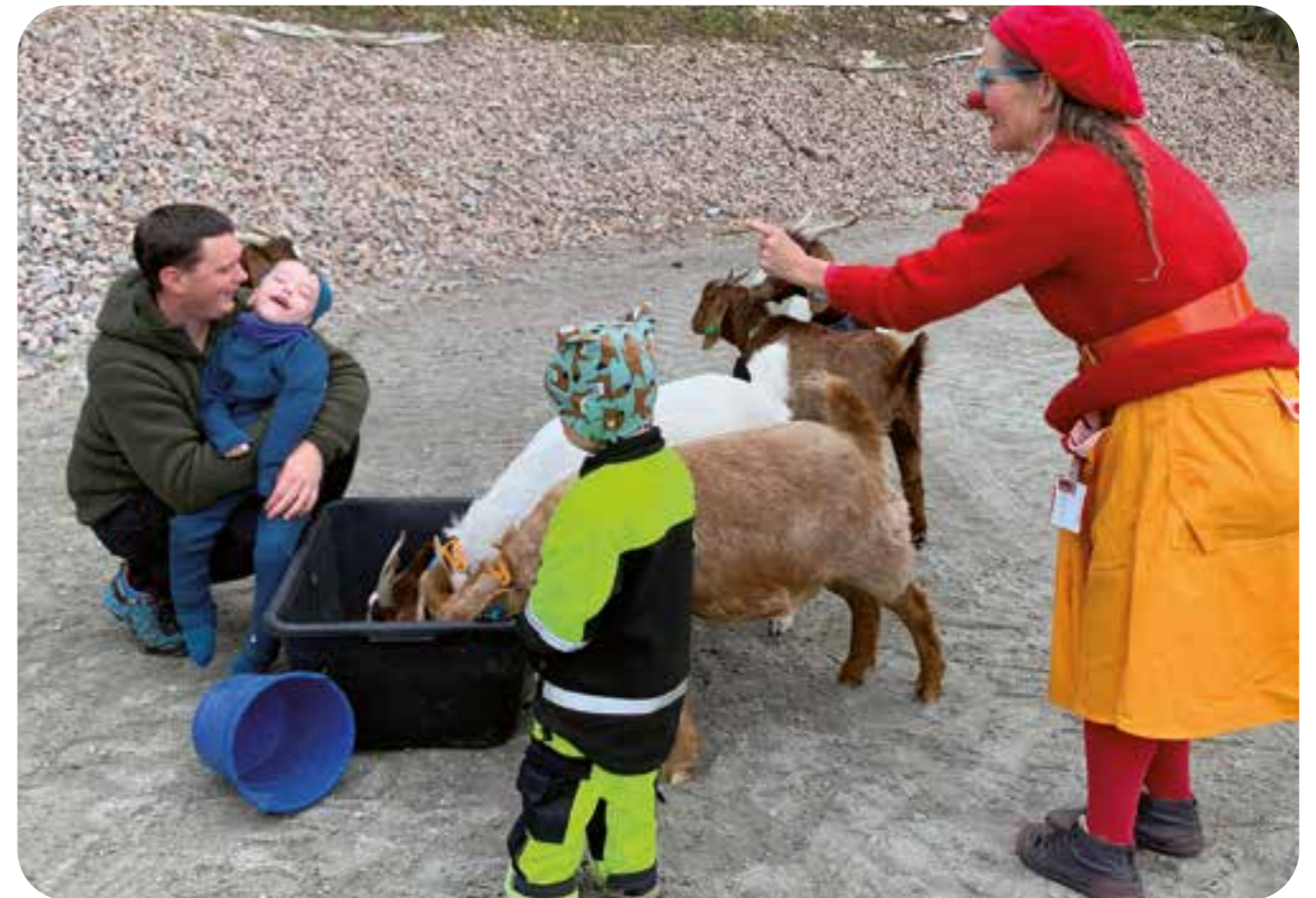
Hele familien var med da sykehusklovnene fikk omvisning på gården.