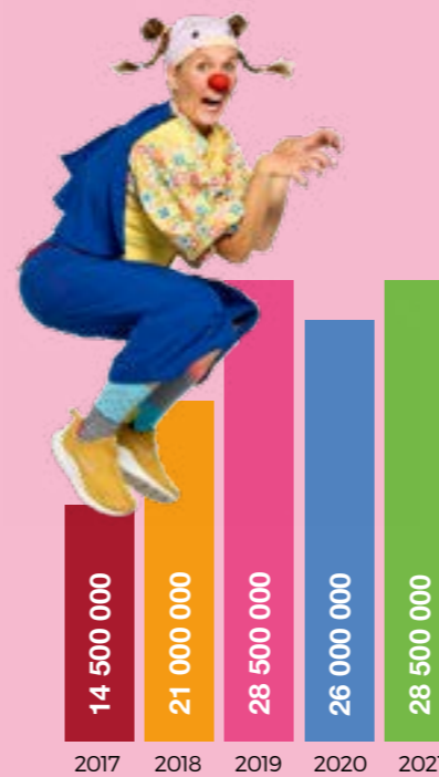
Inntekter pr. år