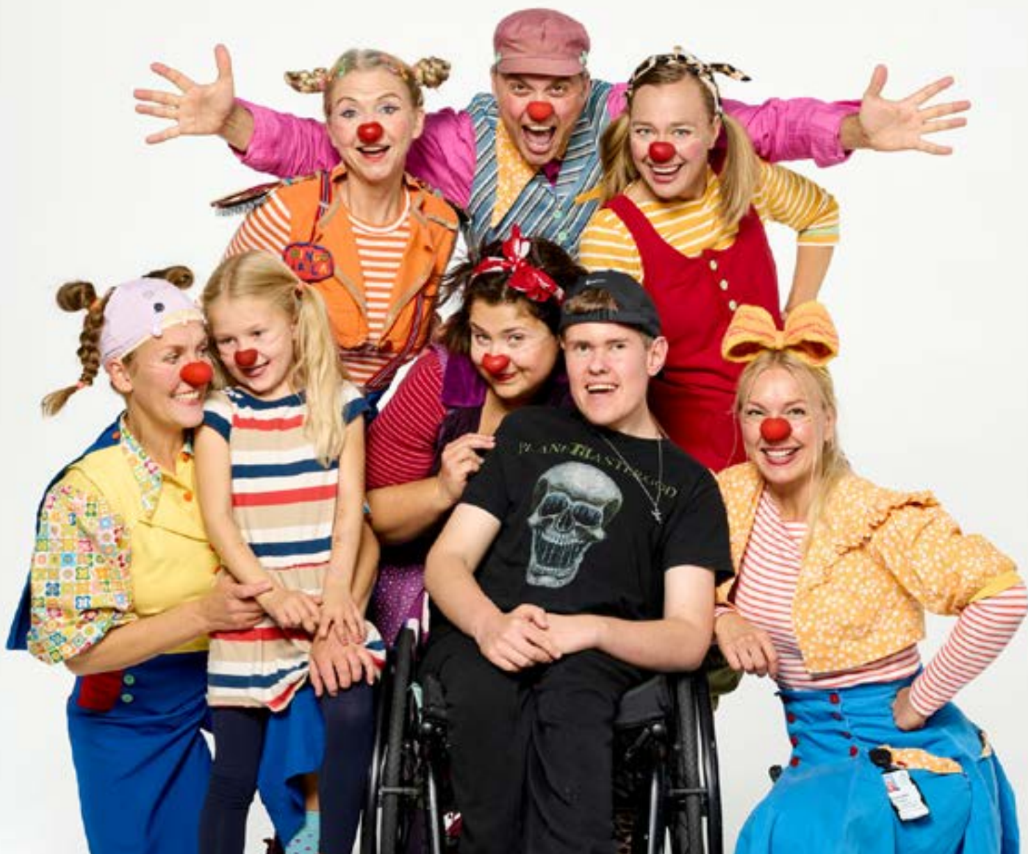
Takk til Rolf Ottesen AS for probnotrykk