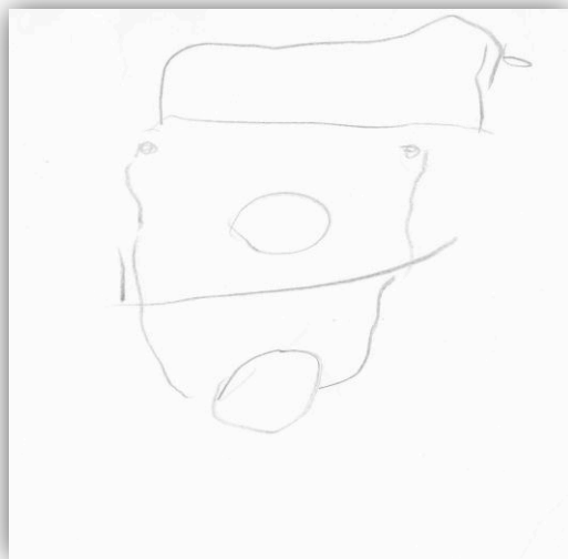
Figur 2: Victoria, 5 år, tegning av klovnen.

På spørsmål om hva hun likte best, svarte Victoria selv ”... at noen syngte inne.” Victoria uttrykker også at klovnenes nærvær var overraskende: ”Klovner pleier ikke være på sykehuset”. Mors beskrivelse av hva hun tror var mest positivt for datteren var preget av muligheten til medbestemmelse “... Få fram smilet hos henne i hvert fall, kjempegøy å bli involvert i det de gjorde. Det tror jeg hun syns var gøy.” “... hun syns sikkert det var spennende at de ble med inn på rommet, at det ble litt intimt da, eller at hun fikk litt sånn oppmerksomhet...” “... hun fikk jo være med i leken, ble jo inkludert. At hun fikk lov til å spille trekkspill for eksempel...” Det ser ut til at klovnene var et positivt overraskende element, som opplevdes som annerledes og uvanlig (se figur 2). Kan det ha vært i dette møtet at det å få bestemme klovnenes bevegelser gjennom å spille på trekkspillet hadde betydning? At klovnen slik ble en ”marionett” i Victorias hender? Det kan også ha vært det vitaliserende tempoet som var viktig, stimulert gjennom klovnenes uortodokse oppførsel.