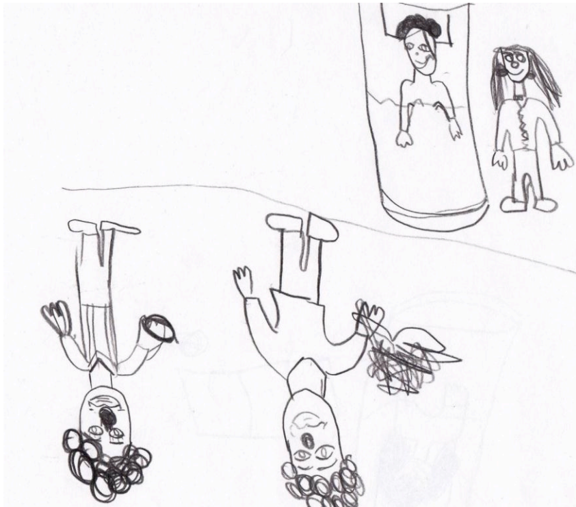
Figur 1: Ingvild, 11 år, tegning av møtet med klovnene.

følelsen av å bestemme, og irttesette klovnene som hadde gjort noe feil. Slik kommer Ingvild i en selvhevdende posisjon, med de underkastende klovnene til sin disposisjon.